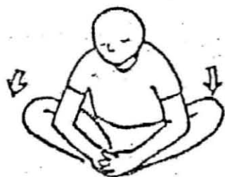
足の裏を合わせ脚を開き 体を曲げる 10秒

※背骨と腰を伸ばすためにうつぶせに寝ることも大変効果があります。テレビを見ている時でも5～10分ほどうつぶせに寝ましょう。