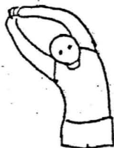
上げた手を左右にたおす 10秒間それぞれ1回