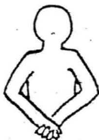
腰の後ろで手を組む 10秒間1回