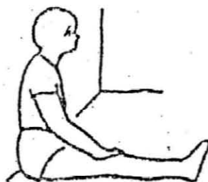
前の方法が困難ならば 壁を利用し膝を伸ばして座る。