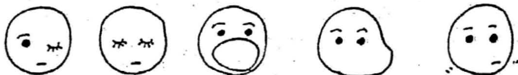
片目ずつ閉じる 両目を閉じる 口を大きく開く 頬をふくらます 下あごを左右に