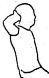
頭の後ろに両手を組む 10秒間1回