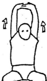
両手を上につきあげる 10秒間×2回