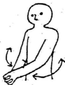
体をねじる 左右に2回ずつ