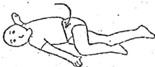
寝返りを右と左に2回ずつ