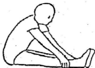
膝を伸ばし体をまげる 10秒間1回