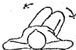
体を左右にねじる 左右それぞれ10秒