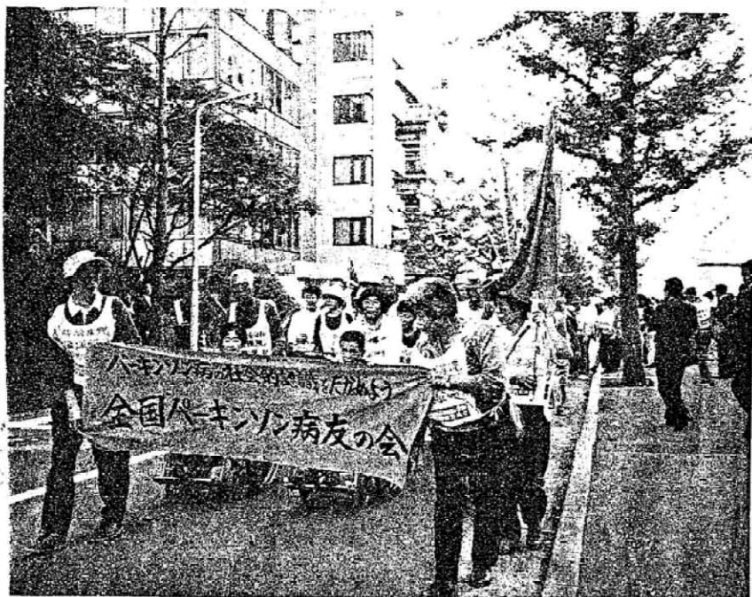
「JPC」国会議員/農が関付近をデモ行進風景/1993. 11. 15